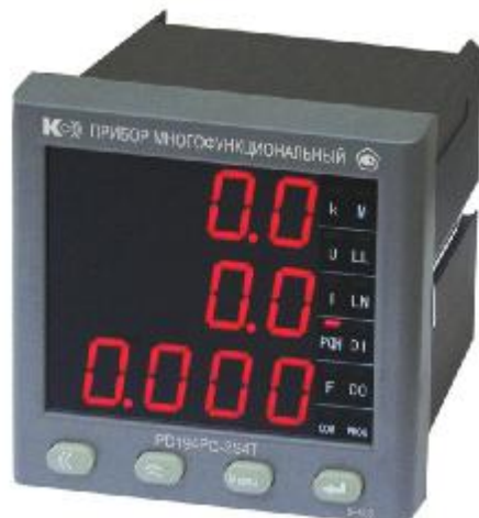
Прибор многофункциональный PD194PQ-2S4T